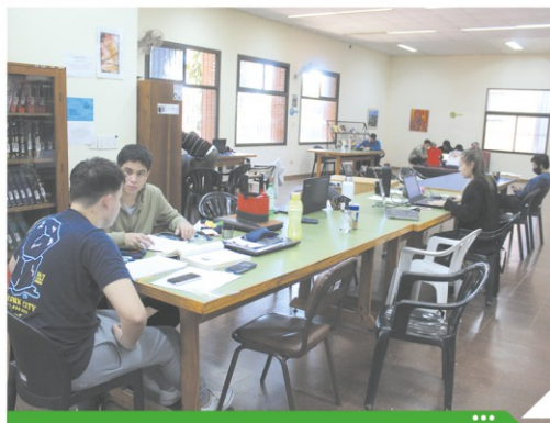
"Me ha tocado ser usuaria y, desde ahí, comencé a aprender a buscar, primero a través de mi disciplina y luego lo fui ampliando a otras carreras."

El inmueble se compone de cuatro salones adaptados a distintas modalidades de estudio. En este sitio, la visión de la biblioteca no es solamente la de un es-