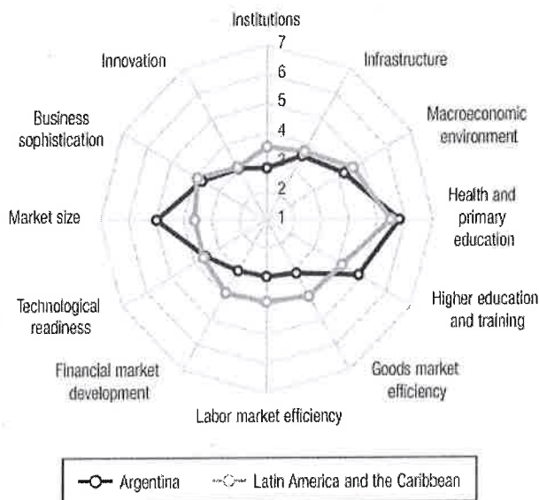
Figura 1. Índice de Competitividad Global 2014-2015: Puntaje obtenido por Argentina y Latinoamérica y el Caribe. Fuente: SCHWAB (2014).